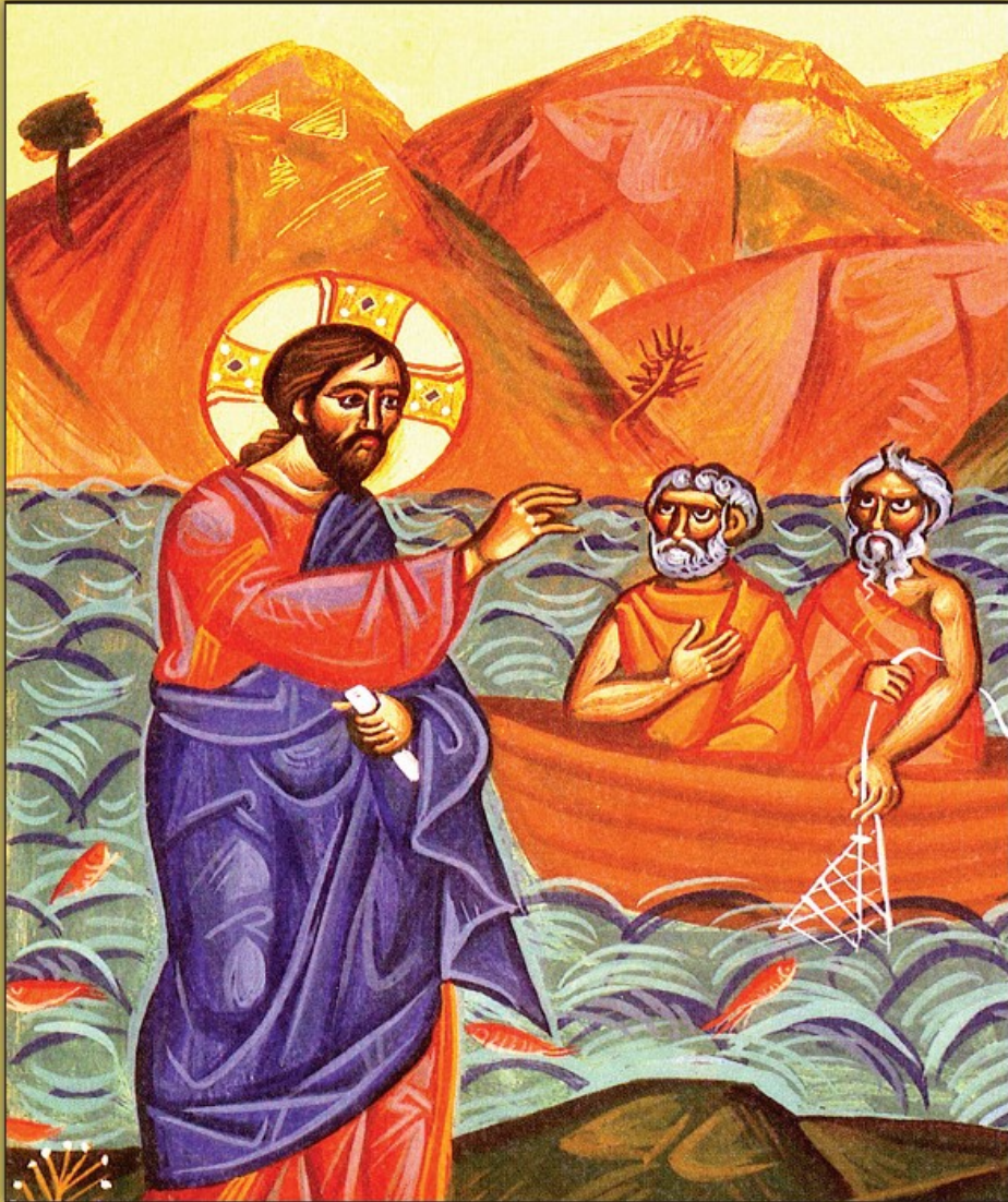
Icon of the Calling of Peter and Andrew