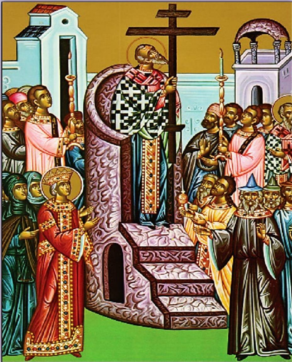
Icon of the Exaltation of the Holy Cross -- September 14th