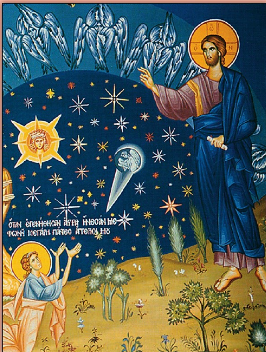
Icon of Creation