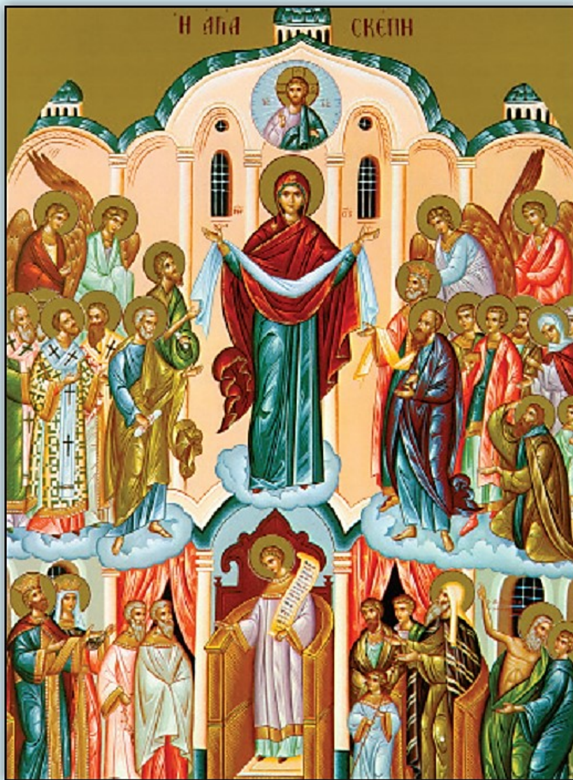
Icon of the Protection of the Mother of God -- October 1st