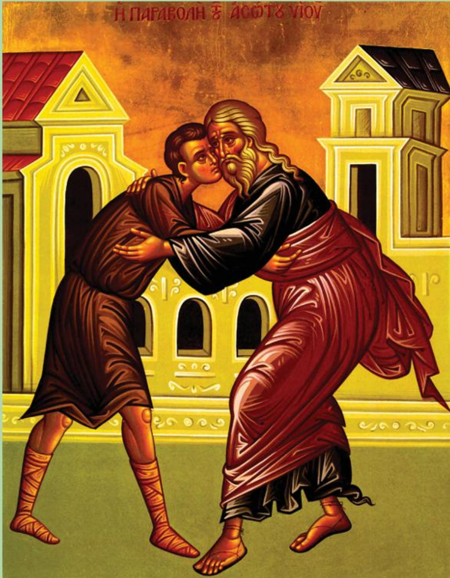
Icon of the Prodigal Son