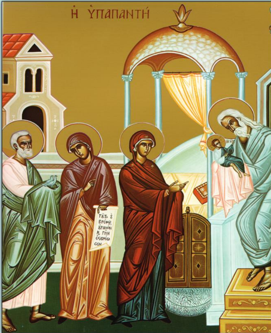
Icon of the Presentation of Our Lord -- February 2nd